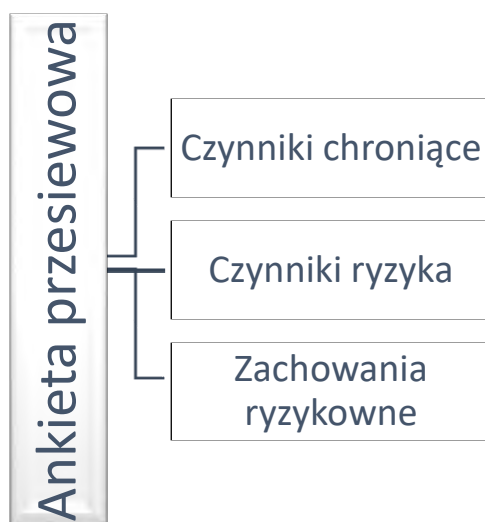
Ryc. 2. Pierwszy etap diagnozy – przesiewowy

Grupa wysokiego ryzyka zostanie wyróżniona poprzez specjalnie opracowany indeks zachowań ryzykownych (ryc. 1). Na indeks ten składać się będą następujące zmienne: